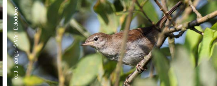
cetti's zanger