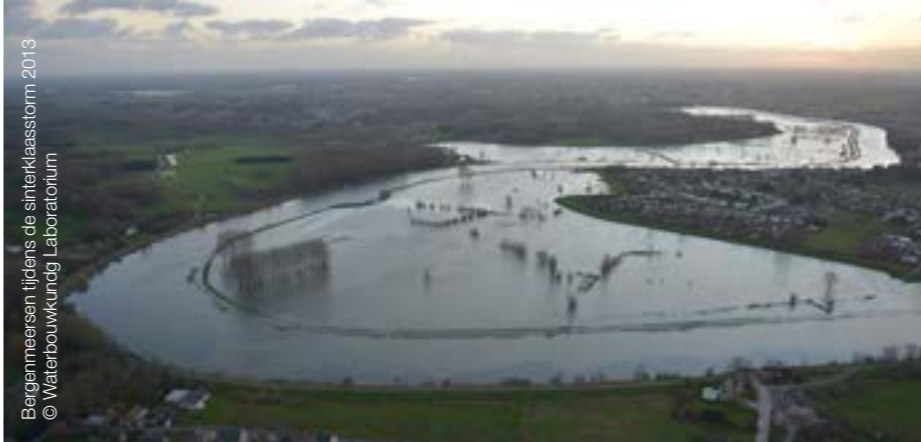
Bergenmeersen tijdens de sinterklaasstorm 2013