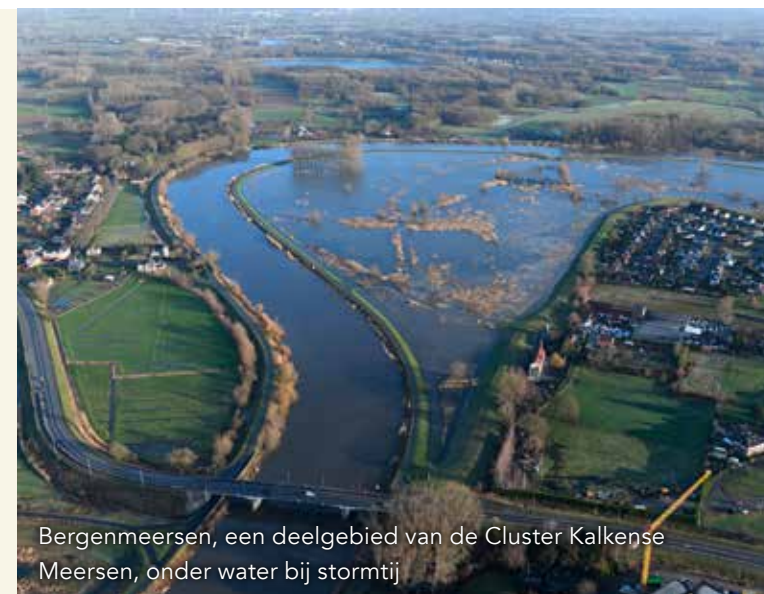
Bergenmeersen, een deelgebied van de Cluster Kalkense Meersen, onder water bij stormtij

De Schelde speelt een belangrijke economische rol. Samen met de Durme creëert ze bovendien unieke natuur. Maar hevige stormvloeden kunnen flink wat waterellende veroorzaken. Daarom wil het Sigmaplan de valleien van deze rivieren beter beschermen.